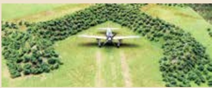
掩体壕(⊕園内で保存されている1基 ⊖模型)