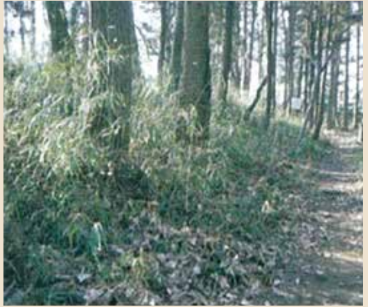
こんぶくろ池横の野馬土手

四十里野と呼ばれた小金が原には江戸時代、幕府直轄の牧(=放牧場)が置かれ、こんぶくろ池付近は小金牧に位置していました。村や畑に馬が入らないように、また馬を捕えるために、野馬土手はいろいろな目的で築られました。馬の水飲み場だったと言われるこんぶくろ池の横など、園内には数か所の野馬土手が現在も残っています。