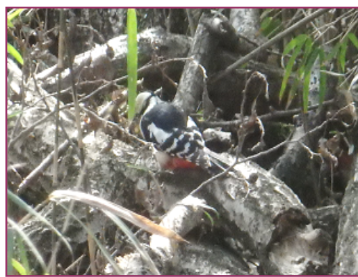
突然地上に降りた天使 (アカゲラ) (2020/3/9)

天敵のオオタカを恐れたのか？森には採餌木が少ないのか？高木に凜としてとまるイメージから哀れさを感じます。