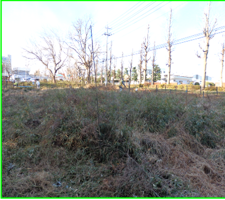
ササや雑草が繁茂して荒れた草地 (2020/1/16)