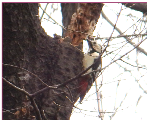
森の守人、樹上のアカゲラ (2020/3/9)