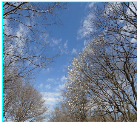
天上の花 コブシ (2020/3/12)

今年も季節は巡り、天上の花、コブシが公園入り口で来園者をお迎えするかのように天高く花を咲かせました。一方、公園の草地には、早春の天使、アマナの群生が広がり、可憐なチューリップのような花を沢山咲かせていました。