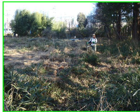
雪山ラッセルのようにササヤブを刈り 取り中 (2020/1/16)