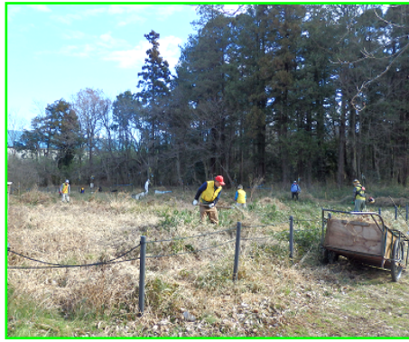
全員作業で刈り取り奮闘中 (2020/1/16)