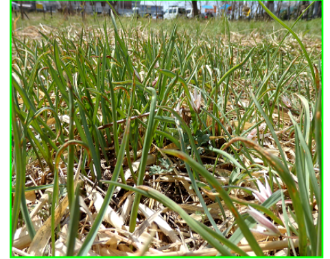
早春のアマナの芽生え (2020/3/12)

今後は、この種の下草刈りを計画的に実施し、これから植栽するズミとアマナ等の貴重な草本類が、共存して生育する環境を創り上げるのが大切です。この際、湿地林において、ズミとコバギボウシやツリフネソウが上手く共存している状況を手本にするとともに、この草地に生息する生き物等との共生についても配慮することが必要と思料します。