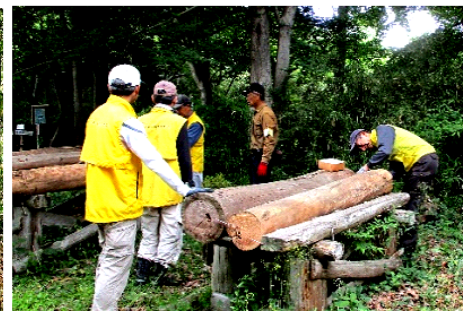
伐採木の活用 ベンチ製作