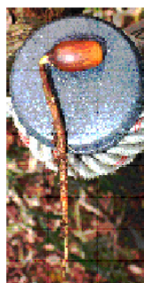
生物多様性 維持の取組