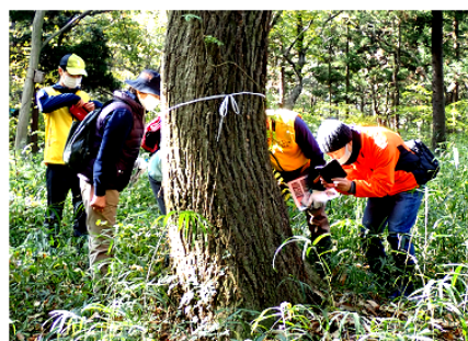
気候変動の影響 生態系の保全調査