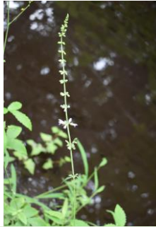
アキノタムラソウ 秋の田村草 シソ科