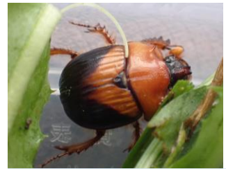
ムネアカセンチコガネ センチコガネ科