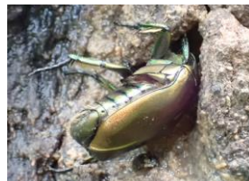
カナブン コガネムシ科