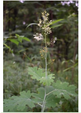
タケニグサ 竹似草 ケシ科 茎が中空で竹に似るが、折ると有害な黄色い乳液が。この写真の開花した花に虫がいる！