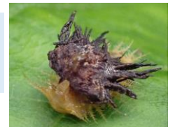
イチモンジカメノコハムシ (幼虫) ハムシ科