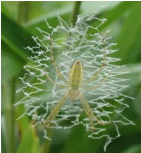
ナガコガネグモ (幼体) コガネグモ科