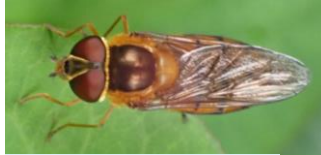
ハナアブのなかま