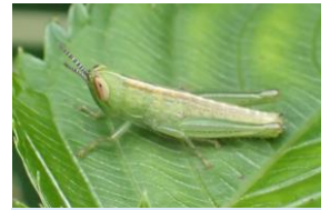
イナゴのなかま (幼体) イナゴ科