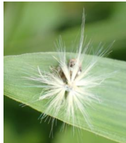
ベッコウハゴロモ (幼虫) ハゴロモ科