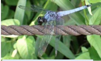
オオシオカラトンボ トンボ科