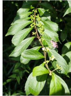
コムラサキ 小紫 シソ科 落葉低木。枝先から、つばみ→花→果実の順番が一目瞭然。