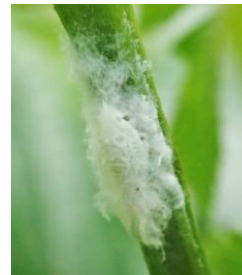
アオバハゴロモ (幼虫) アオバハゴロモ科