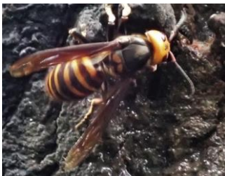
オオスズメバチ スズメバチ科 樹液にはハチが訪れるのでご注意を!!