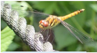
ナツアカネ トンボ科