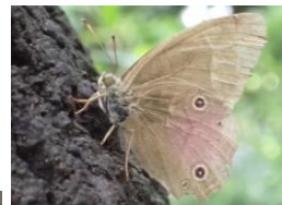
ヒカゲチョウ タテハチョウ科