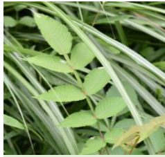
ヌルデ 白膠木 ウルシ科 落葉高木の幼木