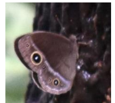
コジャノメ タテハチョウ科