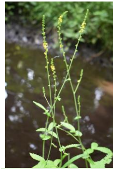
キンミズヒキ 金水引 バラ科 果実はくっつきやすい。