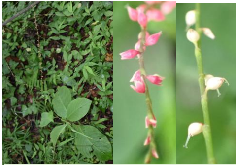
ミズヒキ 水引 タデ科 花序を上から見ると赤色で、下から見ると白色。紅白の水引のよう。