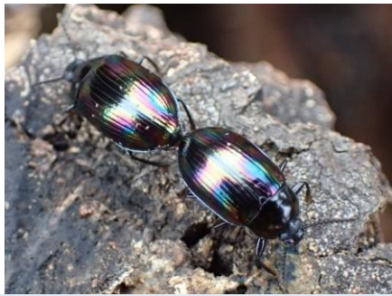
ヒメナガニジゴミムシダマシ ゴミムシダマシ科