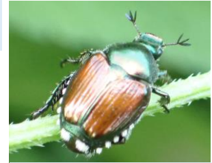
マメコガネコガネムシ科