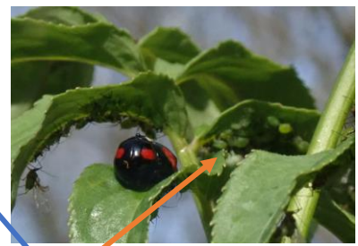
テントウムシ (体長5~8mm)