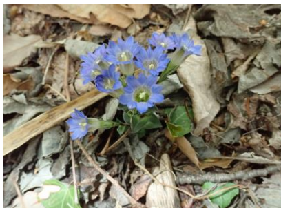
フデリンドウ 名は茎の先の花の様子から。 花言葉は「高貴」「誠実」「真実の愛」など。 開花株数は51株を確認。