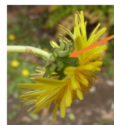
カントウタンポポ