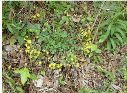
キジムシロ 放射状に広がる花を雉が座っていたムシロに見立てた。