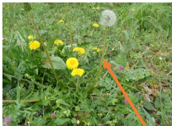
カントウタンポポ