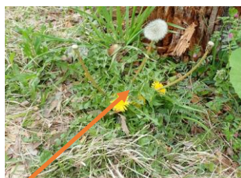
セイヨウタンポポ