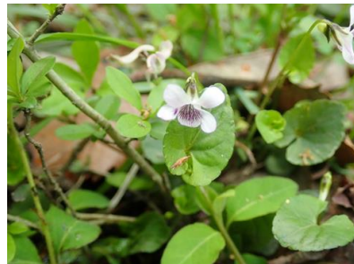
ツボスミレ (ニヨイスミレ)