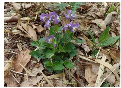
ニオイタチツボスミレ