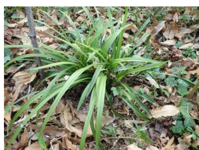
シュンラン 春に花を咲かせる蘭。 花言葉は「控えめな美」「気品」「清純」など。 開花株数は4株を確認。