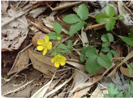
ミツバツチグリ 葉が3小葉が特徴です。